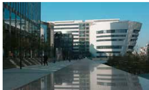
SKEMA 商学院拉德芳斯校区